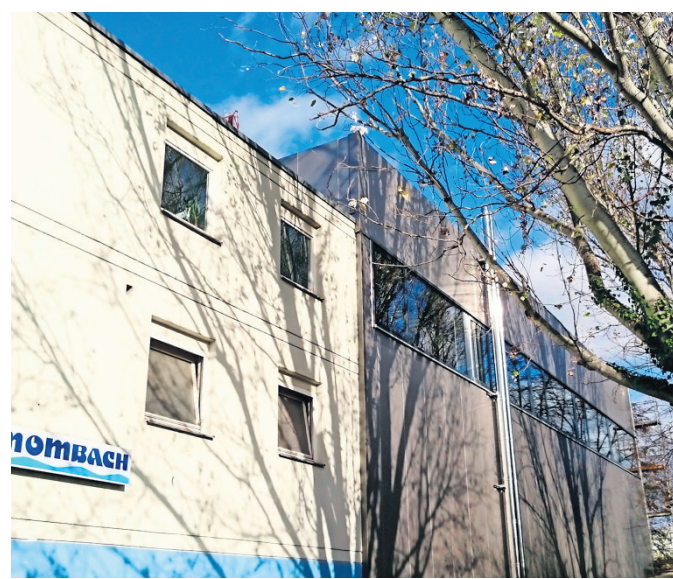
Das Mombach-Bad ist nach langer Sanierungszeit keine Baustelle mehr, sondern wieder eine Schwimmstätte für Klein und Groß, für Freizeitschwimmer und Leistungssportler.

auch Kinder und Jugendliche mehrerer Schulen. Einen Eindruck vom Mombach-Bad verschaffen und sich die neue alte Schwimmstätte anschauen, kann man beim Tag der offenen Tür,